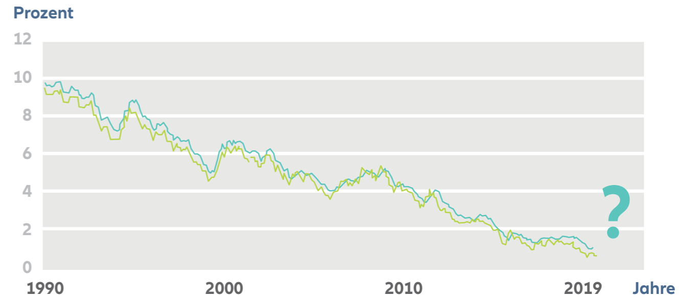
— Zinssatz Gesamtmarkt, Laufzeit 10 Jahre — Zinssatz Allianz Baufinanzierung, Laufzeit 10 Jahre

Die Zinsen sind derzeit sehr niedrig. Es kann aber gut sein, dass sie wieder steigen. Deshalb sollten Sie sich überlegen, jetzt zu handeln.